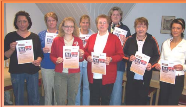
Das Lichtblicke Betreuungsteam

Für unser weiter auszubauendes Betreuungsangebot suchen wir kontinuierlich zusätzliche Betreuungskräfte. Sie werden von uns auf der Grundlage des Malteser Ausbildungsmoduls „Beschäftigungsassistenz“ Schritt für Schritt auf Ihre Aufgaben vorbereitet, damit Sie gegen eine moderate Aufwandsentschädigung qualifizierte Hilfe leisten können. Den Umfang Ihres Engagements bestimmen Sie selbst entsprechend Ihren zeitlichen Möglichkeiten und Freiräumen.